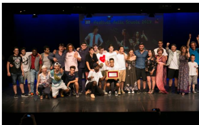
I vincitori dell'edizione 2019: Istituto Leonardo da Vinci di Mantova