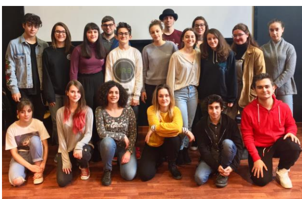
Festival 2019: la Giuria di ragazzi e ragazze

provenienti da tutte le scuole in concorso, che dovranno valutare testo e recitazione, grado di difficoltà e originalità, costumi, scene e musiche degli spettacoli in gara. La giuria è senz'altro una delle cose più belle nonché il simbolo di questa rassegna dedicata ai più giovani. Al termine della manifestazione, la scuola prima classificata riceverà un premio in denaro pari a euro 1.500 , che la scuola si impegna a spendere nell'organizzazione di attività culturali destinate agli allievi.